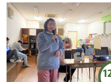
12/31 火 カラオケ♪紅白歌合戦 大晦日にみんなで紅白歌合戦♪お気に入りの曲を歌って、お汁粉も作って楽しい年の瀬になりましたよ^^