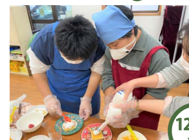
12/13 金 クリスマスデコレーションケーキ♡ カステラ、生クリーム、苺などみんなが好きな材料でクリスマスケーキ作り☆満面の笑顔でいただきました。