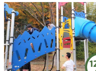
12/4 水 朱雀ふれあい公園 冬の寒空の中、子どもたちはそれぞれ遊具や園内の散策、スポーツをして元気に遊んでいました！