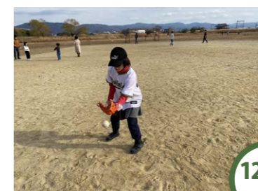
12/30 月 につこり野球部 キャッチボールやノックで守備力向上を目指しました！次回はバッティングを磨きましょうね♡