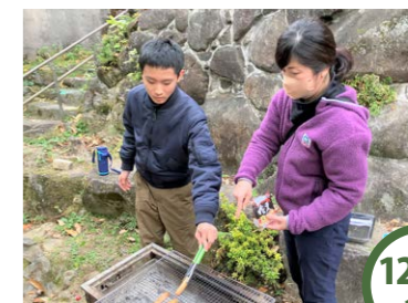
12/13 金 冬野菜を食べよう 炭火で焼いたソーセージとたっぷりの野菜でスープを作りました。お腹の中から温まっておいしかったね！