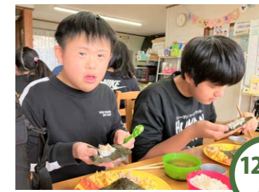
12/30 月 手巻きずしパーティー☆ みんなで具材を考えた手巻きずし☆マグロやサーモンみんなの大好きが集まって最高のパーティーに♪