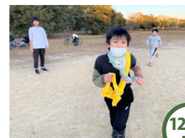
12/12 木 につこり駅伝☆ 2チームに分かれて襷をつないで走り抜けました^^箱根駅伝に負けないうくらい大盛り上がりでしたよ。