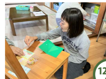
12/3 火 X'masカードをつくろう 切り取り線に沿ってハサミでちよきちよき♪台紙に貼って、飛び出すX'masカードのできあがり♡