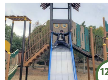
12/28 土 榎本高塚公園 寒さに負けず元気に遊びました。遊具で人気なのは四種類ある滑り台！とっても楽しかったね♪