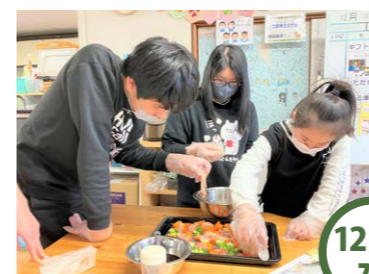
12/18 水 チキンと野菜のX'masグリル 野菜と鶏モモ肉を一口大に切り、下味をつけてオープンへ。X'masにぴったりのごちそうができました☆