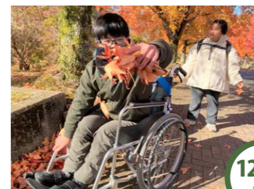
12/7 土 生駒山麓公園 楓並木を歩いてアスレチック広場へ。落ち葉を拾い舞い上げたり、すべり台をすべって遊びました♪