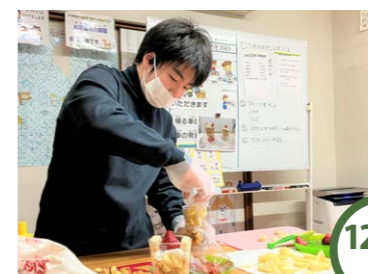
12/26 木 X'masケーキをつくろう ギフトで焼いたスポンジ、フルーツ、生クリームをグラスに盛りつけ♡可愛いX'masケーキにみんな大満足。